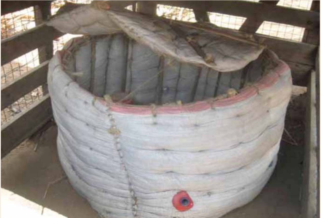
Chombo cha asili cha kutunza joto – vifaranga